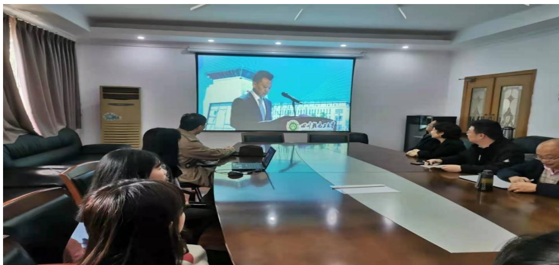
图 1 会议现场

通过此次学习，学生不仅深入了解培育科学素养的重要性，还知晓树立优良学风和恪守学术道德的意义，有利于进一步加强学生对科学素养的全面认识与了解，坚定学生树立优良学风和恪守学术道德的决心，对学生科研能力及素养的提高起到了推动作用。