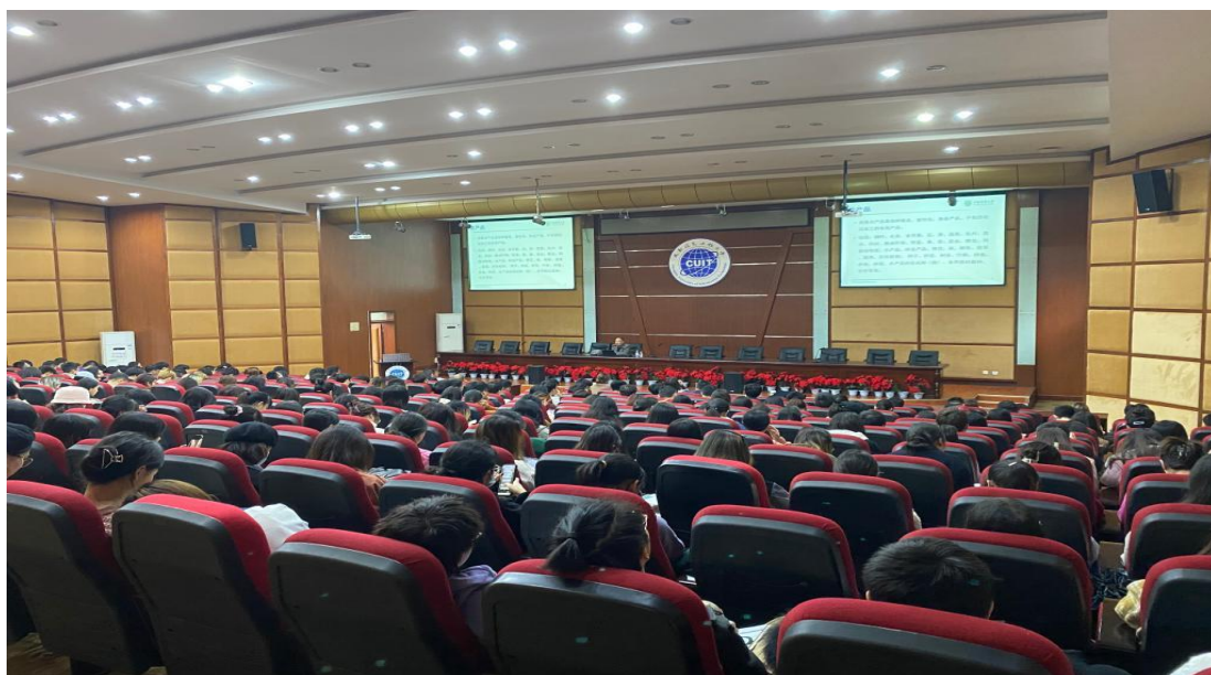
图 1 活动现场

在交流与讨论环节，老师和同学们踊跃提问，吕教授围绕农村电商、绿色供应链、供应链中的信息共享等话题分享了自己的看法。最后，施莉教授进行了总结，感谢吕建军教授在百忙之中到我中心作学术报告。讲座于掌声中落下帷幕，与会师生表示获益良多、意犹未尽。