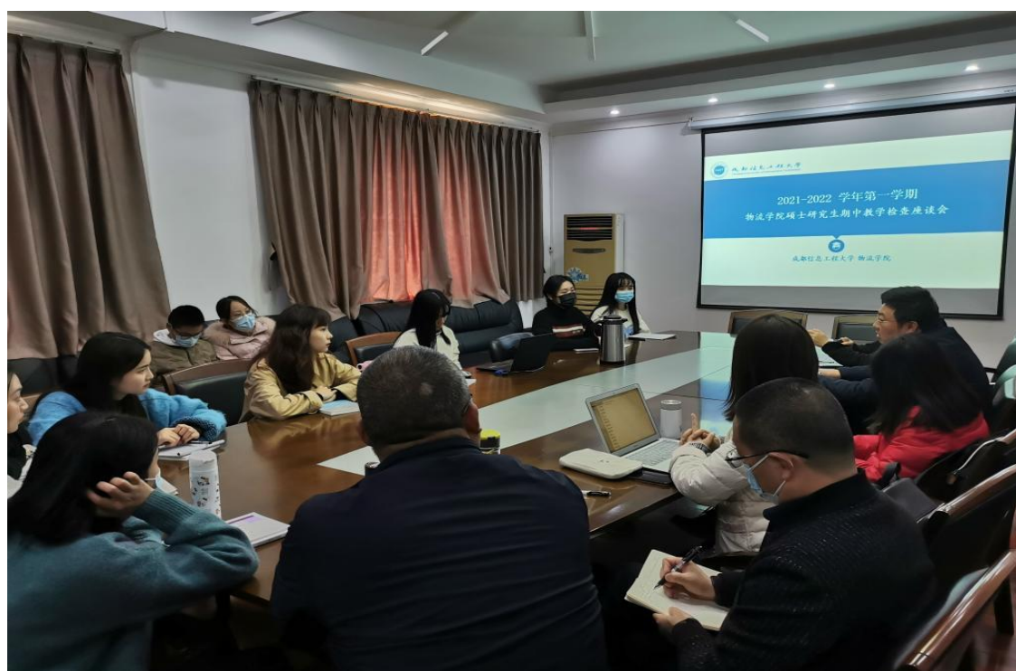
图 2 座谈会现场

本次研究生期中教学检查座谈会通过老师和学生面对面的沟通，加强学生与老师之间的了解。意在引导研究生尽快了解和适应新阶段的生活及学术研究，激发学习研究的积极性和主动性，帮助学生合理规划学习生活和未来发展。