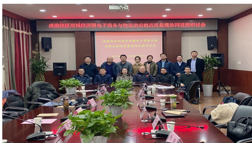
图 2 中心组织召开成渝地区双城经济圈电子商务与物流供应链高质量暨协同发展研讨会（2021.12.30）